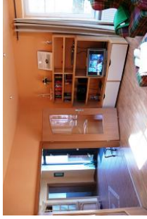
Licht, Luft und viel Platz.