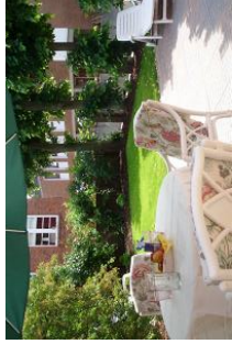
Wohnen im "Grünen" und dem Meer so nah.