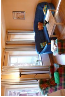
Überall spürbar: die Liebe zum Detail.