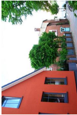
Ein behagliches Zuhause. Freuen Sie sich darauf.

Die Unterkunft verteilt sich über EG und 1.OG.