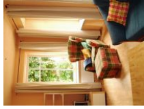
Ein gutes Buch, ein Glas Wein und die Zeit vergessen.