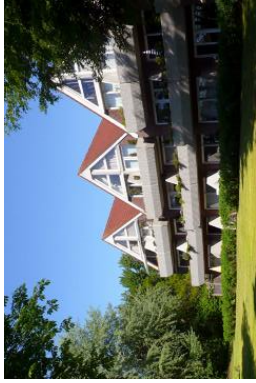
Die Unterkunft befindet sich im 2.OG.

Wohnen Sie abseits des Trubels und der Stadt, und doch so nah. Die Innenstadt erreichen Sie in nur wenigen Gehminuten.