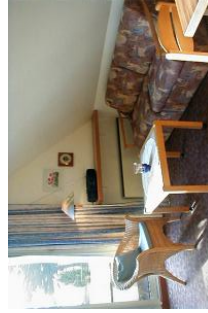
Überall spürbar: die Liebe zum Detail.

Unser Haus Meeresrauschen ist ein gepflegtes Reihenhauses im Olhörnweg, nur wenige Meter vom Meer entfernt. In diesem Haus vermieten wir die Wohnung "Meeresbrise" und "Meeresrauschen". Alle wichtigen Versorgungseinrichtungen wie Bäcker, Supermarkt usw. befinden sich in unmittelbarer Nähe. Das Zentrum von Wyk sowie das Meerwasserwellenbad aquaFöhr erreichen Sie zu Fuß in wenigen Minuten. Die Wohnung "Meeresbrise" besteht auf ca. 60m 2 aus einem Schlafzimmer mit zwei Einzelbetten, einem zusätzlichen, geräumigen Zimmer mit Wohnschlafzimmer ( Schlafsofa ) und einer integrierten Küchenzeile. Ihren sonnigen Balkon mit Meerblick erreichen Sie direkt vom Wohnzimmer aus. Aufgrund der Nähe zum Strand, der ruhigen und gemütlichen Einrichtung bietet die Wohnung Meeresbrise alle Voraussetzungen für einen wunderschönen Urlaub!