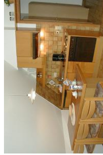
Hier werden Sie gerne kochen.