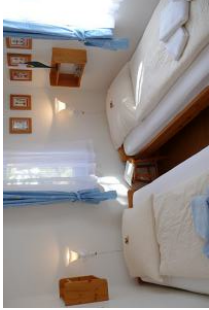
In dem gemütlichen Schlafzimmer genießen Sie eine entspannte Nachtruhe zur verdienten Erholung.