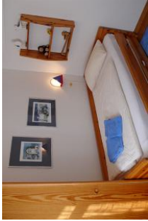
In diesem Bett schlafen die Kinder "himmlisch".