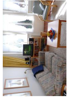
Hier lädt alles zum Entspannen ein.